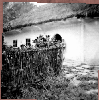
Dom rodzinny w Budzowie