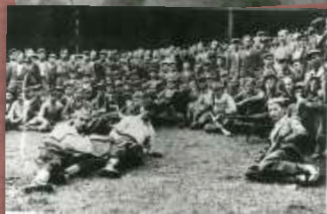
Partyzanci na topieniu