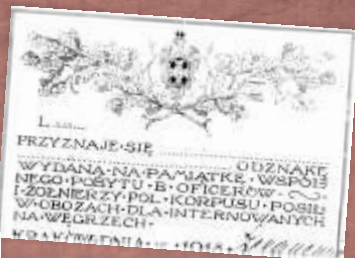
Odnaka pamiątkowa z pobytu w obozie dla internowanych na Węgrzech