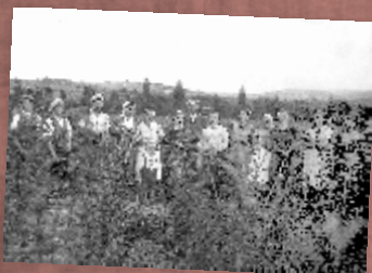
Pracownicy szkółki drzew owocowych