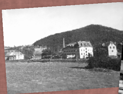
Budynki zakładowe i szkoły lata 40. XX w.

Pomagał w każdy możliwy sposób: fundował stypendia, organizował bursy studenckie, angażował nauczycieli, organizował specjalne kursy dla młodzieży pracującej itp. Jego szczególną zasługą było utworzenie w Tymbarku pierwszej średniej szkoły, o profilu przetwórstwa i handlu ogrodniczego. Na początku swego istnienia była to szkoła finansowana przez Spółdzielnię. Rozpoczęła działalność jako Spółdzielcze Liceum Przetwórstwa i Handlu Ogrodniczego II stopnia.