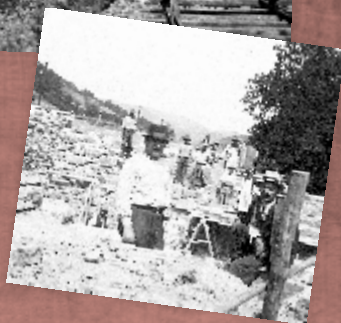
Grupa naukowców SGGW na terenie Owocarni

Bardzo duże znaczenie miała także istniejąca tu stacja kolejowa, dzięki której ułatwiony był transport owoców. Na tymczasową przechowalnię Spółdzielnia Mleczarska odstąpiła bezpłatnie część swoich piwnic, gdzie przeprowadzano próby związane z przechowywaniem owoców. Tak więc Spółdzielnia zaczęła już działać, mimo iż formalnie jeszcze nie powstała.