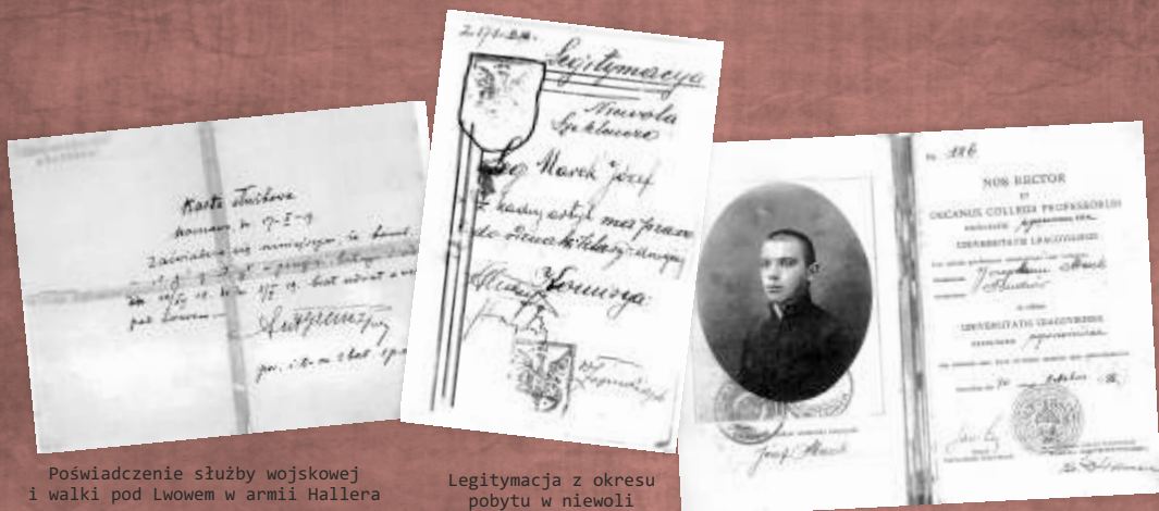
Poświadczenie służby wojskowej i walki pod Lwowem w armii Hallera