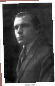
Fotografia z czasów studenckich