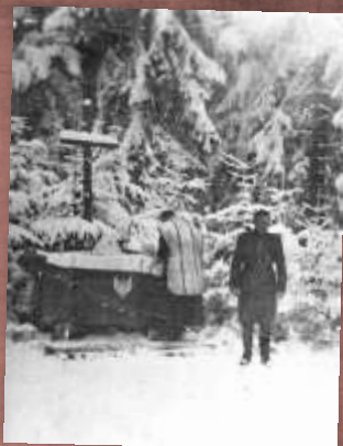
Msza św. na Mogielicy