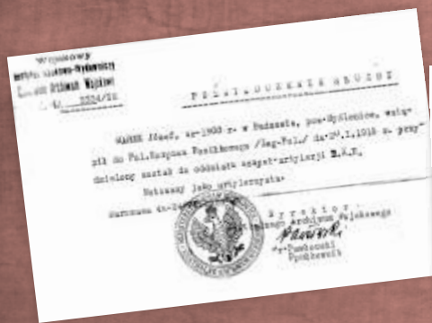
Poświadczenie służby wojskowej w Legionach Polskich