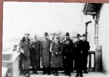
Pracownicy naukowcy SGGW na tarasie budynku Owocarni