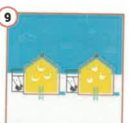
9 Zadbaj o higienę kurników z kurników, a także osobne żywienie i narzędzia.