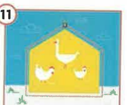
11 Posiadaj tylko kilka sztuk drożdży? Dla ich bezpieczeństwa - kryj je w zamknięciu.