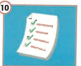
10 Przebiegaj regularnie drożdży takich jak: czyszczenie, odkażanie, dezynfekcja i deratyzacja.