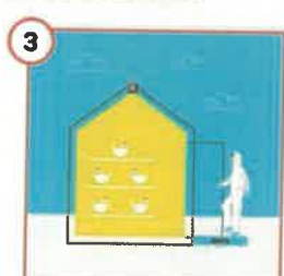
3 Pamiętaj o wszelkich dezynfekcyjnych i regeneracji je również aktywnym środkiem odkażającym.