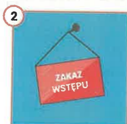
2 Nie pozwól, aby na farmie przebywały osoby niepowołane!