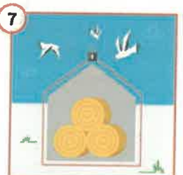
7 Zadbaj o zabezpieczenie drożdży.