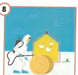
8 Pamiętaj o dezynfekcji drożdży przed włożeniem do kurnika.