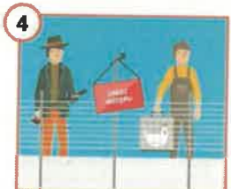
4 Wprowadź zakaz wstępu na farmę osobom mającym kontakt z innymi zwierzętami (np. właścicielom przydomowych kurników, czy innych).