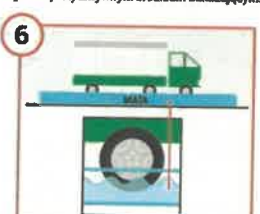
6 Wpuszczaj na farmę wyłącznie pojazdy z zamkniętymi kołami.