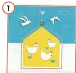
1 Zabezpiecz drób i paszę przed kontaktem z dzikimi ptakami!