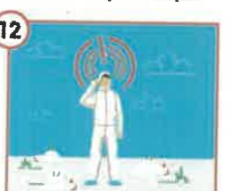
12 Zwiększona śmiertelność wśród drożdży, apatia, niechęć do paszy i wody, spadła wydajność oraz objawy nerwowe (mrużenie, stępy szyi, drżawki, biegunki, duszność) to oznaki - zwróć uwagę! - zakażenia powstającego infekcja wewnątrz.

Przypominamy też, że za brak stosowania zasad bioasekuracji będą nakładane kary administracyjne.